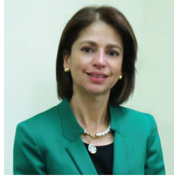
Abogada Ethel Deras Enamorado Vicepresidenta Presidenta de la Comisión Nacional de Bancos y Seguros de Honduras