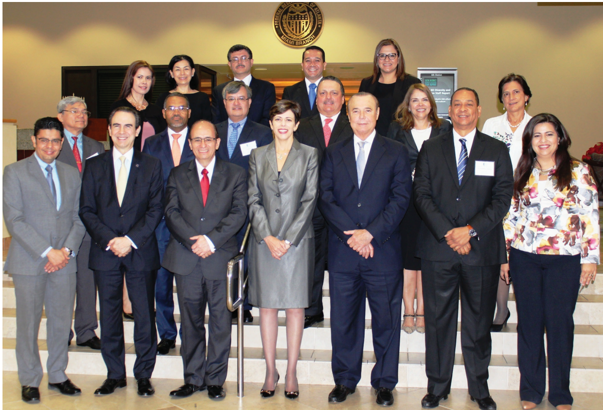
Reunión Asamblea General, Miami, FL., diciembre de 2017