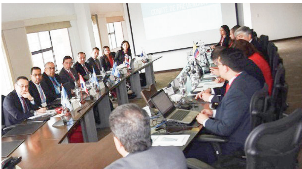
Reunión del Comité de Prevención LA/FT, Bogotá, marzo 2017

El Comité de Prevención de Lavado de Activos y Financiamiento al Terrorismo (CTPLA/FT) enmarcó sus actividades en el objetivo estratégico “Identificar y medir el riesgo de lavado de activos y financiamiento del terrorismo a nivel regional y promover las mejores prácticas para su mitigación”; obteniendo los siguientes avances durante 2017: