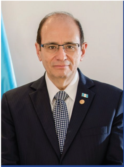
José Alejandro Arévalo Alburez Presidente

Me complace presentar a la Asamblea General la Memoria de Labores 2017, la cual relata brevemente las actividades realizadas por nuestro Consejo durante 2017. Nuestros objetivos se enfocan en incentivar la cooperación y el intercambio de información entre nuestros miembros; la adopción de estándares internacionales de regulación, supervisión e información financiera; y, especialmente, en fortalecer la supervisión consolidada transfronteriza.