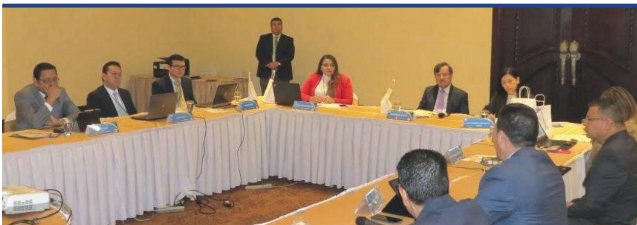
Reunión del CES, Tegucigalpa, Honduras, septiembre 2017