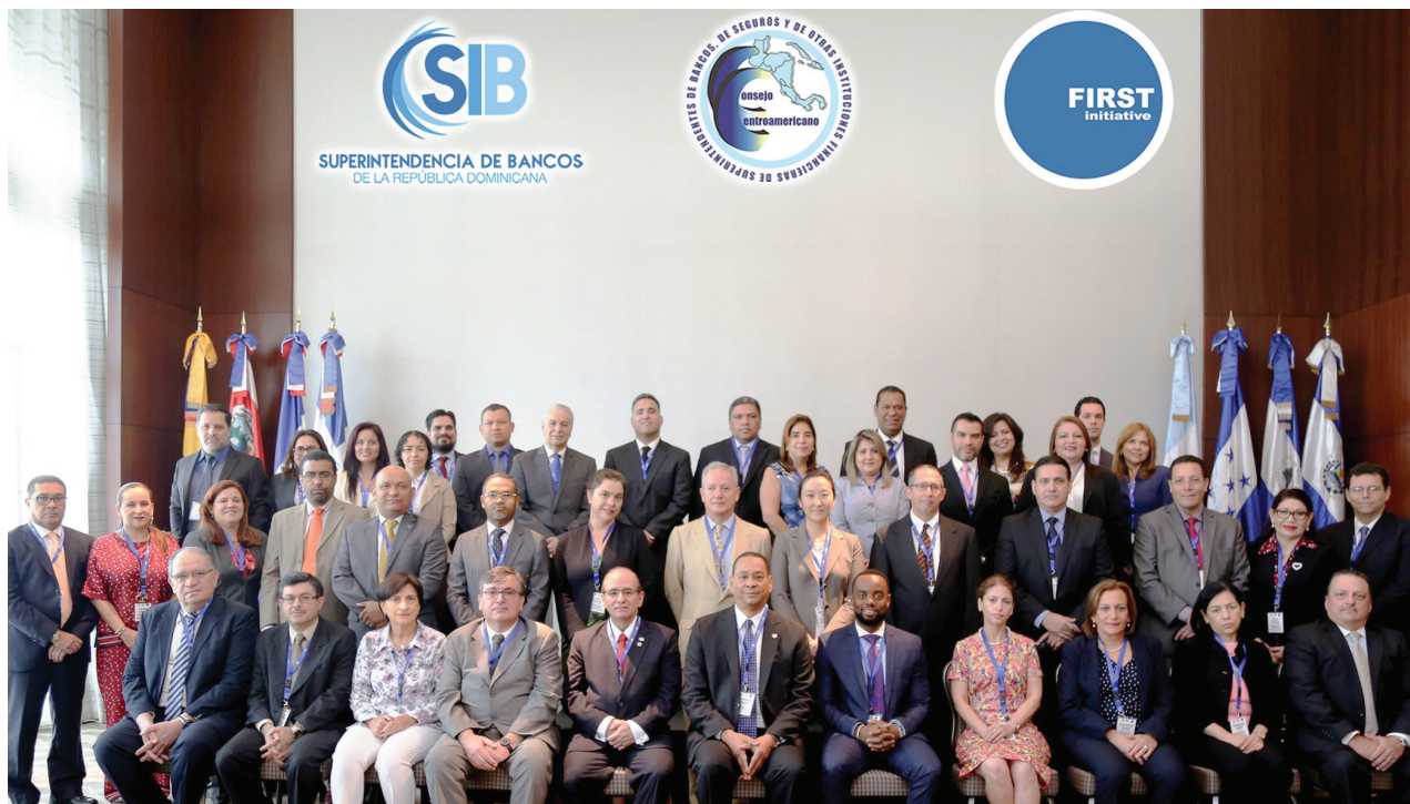
Participantes en ejercicio de simulación de crisis, República Dominicana, julio de 2017

Dentro de este contexto, con el auspicio de la Iniciativa para la Reforma y el Fortalecimiento del Sector Financiero (FIRST) y del Banco Mundial, el 20 de julio de 2017, en Santo Domingo, República Dominicana, se desarrolló el segundo simulacro de crisis financiera regional, el primero realizado en 2012, con la participación de funcionarios de alto nivel de las superintendencias que conforman el CCSBSO y funcionarios de los bancos centrales de Costa Rica, El Salvador, Guatemala, Honduras, Nicaragua y de la República Dominicana.