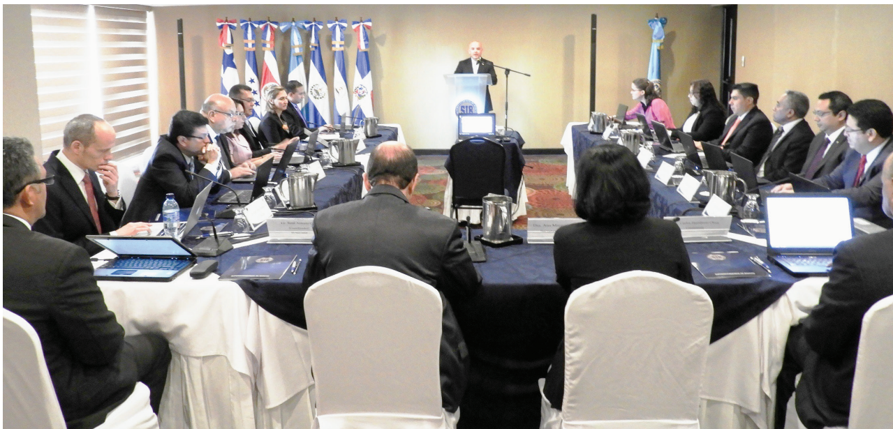
Reunión del CNCF, Guatemala, febrero de 2017

Adicionalmente, el CNCF dio seguimiento a los avances logrados por las superintendencias en sus hojas de ruta para la adopción de NIIF y evaluó los logros alcanzados con el apoyo de la asistencia técnica de CAPTAC-DR en los últimos años. En función de los nuevos requerimientos para la asistencia técnica de CAPTAC-DR, el CNCF también identificó las necesidades de asistencia técnica futura.