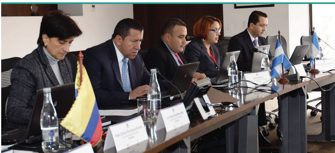
Reunión del Comité de Enlace, Colombia, febrero de 2017